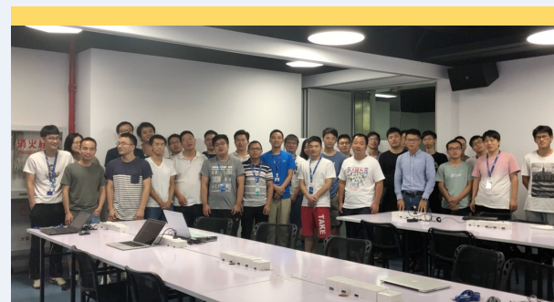
Clean Code & 重构