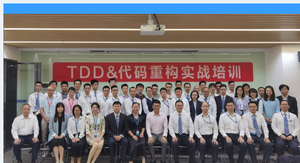
TDD & 代码重构